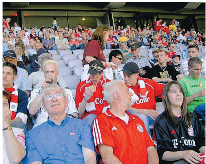
Live ist eben doch am besten: Mitglieder des Furschweiler Fanclubs sind regelmäßig in der Allianz-Arena dabei.