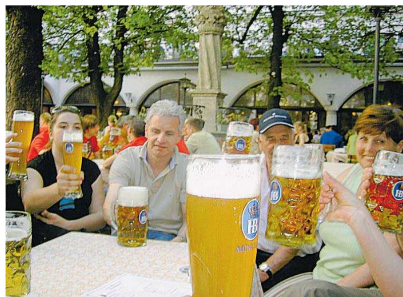
Auch das gehört dazu: Fans aus Furschweiler stoßen im Biergarten auf den Sieg an.