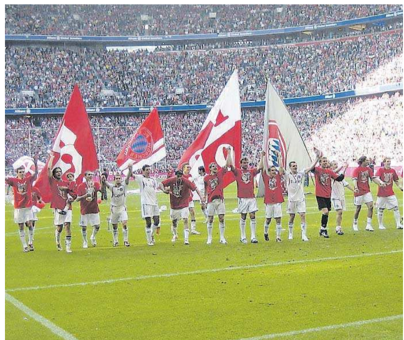
Wenn die Bayern gewonnen haben, lassen sie sich in ihrem Fußball-Tempel, der Allianz-Arena, von den Fans feiern.

enurlaub in Donaueschingen gebracht, weil die Bayern dort ihr Trainingslager absolvierten. Wir waren jeden Tag am Sportplatz.“