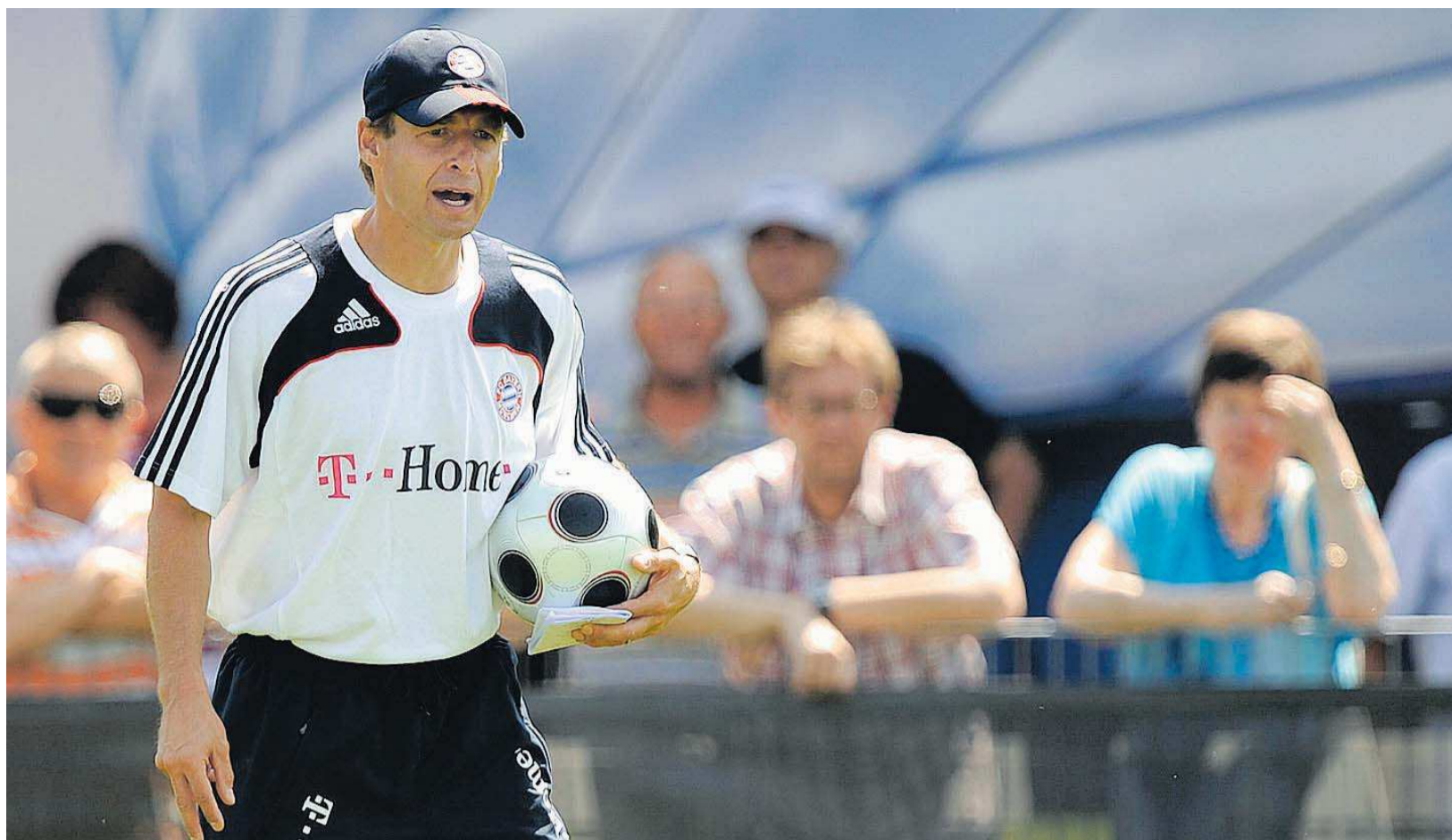
Die Verpflichtung von Jürgen Klinsmann wird von den meisten Bayernfans eher kritisch gesehen. Die Mitglieder der Bayern-Fanclubs aus dem Kreis St. Wendel wollen dem Ex-Bundestrainer, der oft mit unkonventionellen Methoden daherkommt, aber eine faire Chance geben.