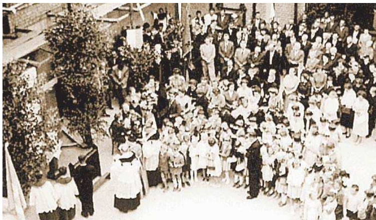
Grundsteinlegung am 3. August 1958.