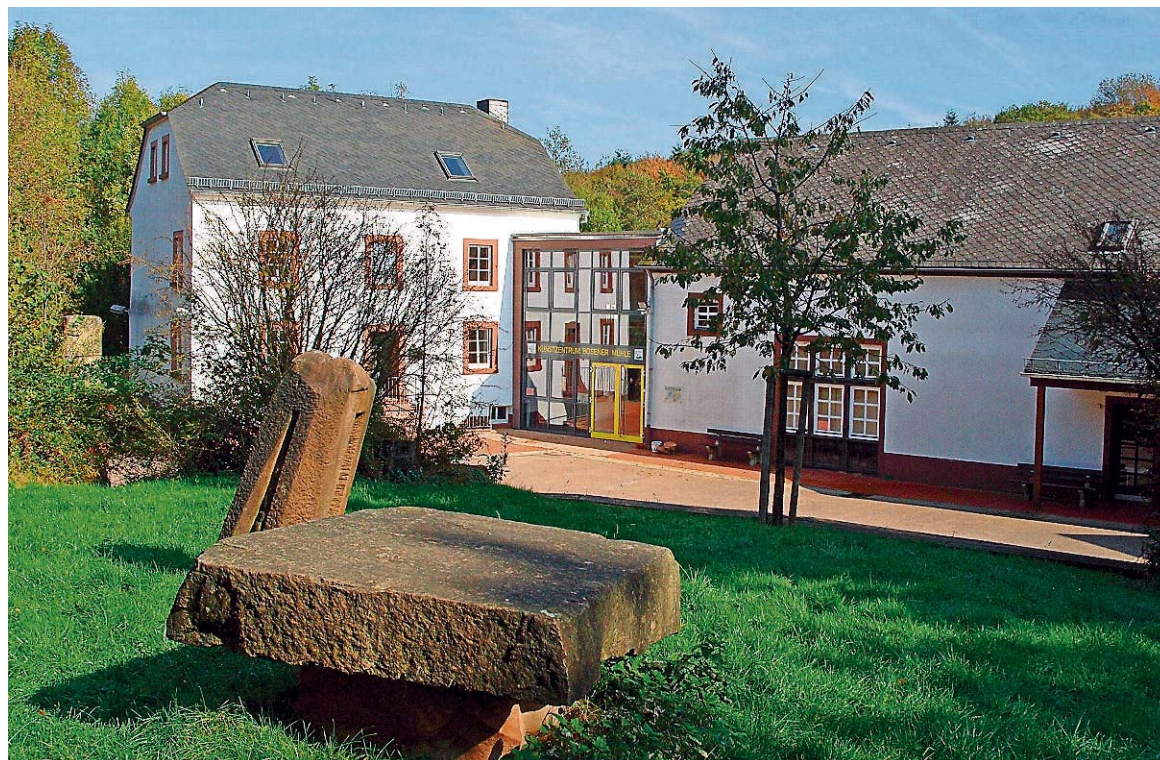
Das Kunstzentrum Bosener Mühle liegt mitten im Grünen.