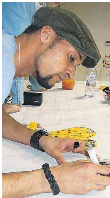
Medlock schreibt Autogramme.

Da gab es gestern viel in der Schule zu erzählen. Noch besucht sie die Grundschule in Nonnweiler. Nach den Sommerferien wird sie auf das Gymnasium nach Hermeskeil wechseln. Und dann wohl immer noch die CDs von Medlock hören: „Ich finde ihn gut – seine Musik und seine Art.“ him