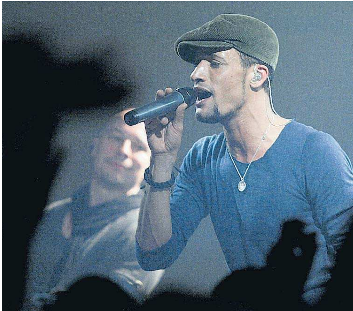
100 Minuten lang zeigt sich Medlock von seiner besten Seite, singt Klassiker und eigene Hits.